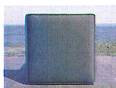
COBERTURAS DE ALMOFADA

Note Bem! Pequenos detalhes podem variar nas fotografias exibidas.