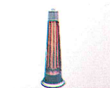
AQUECEDORES DE PÁTIO