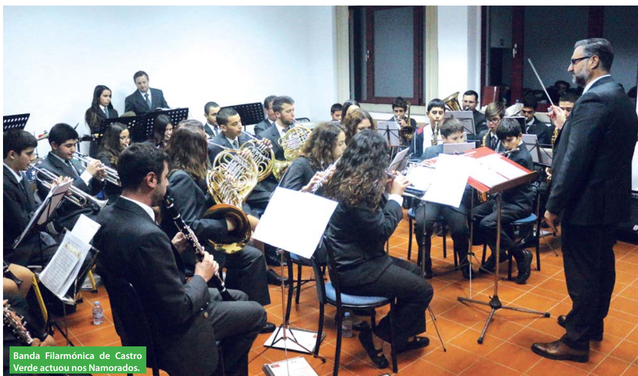
Banda Filarmónica de Castro Verde actuou nos Namorados.