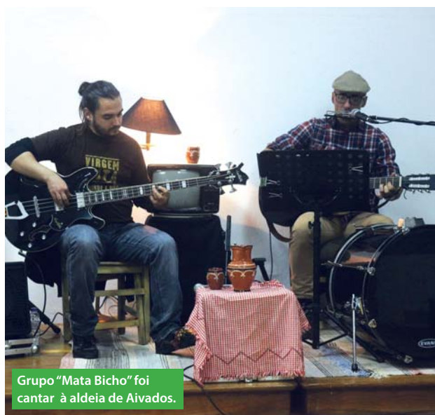
Grupo "Mata Bicho" foi cantar à aldeia de Aivados.