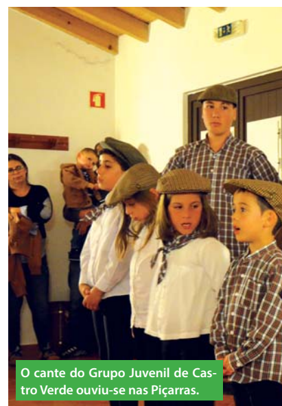
O cante do Grupo Juvenil de Castro Verde ouviu-se nas Piçarras.