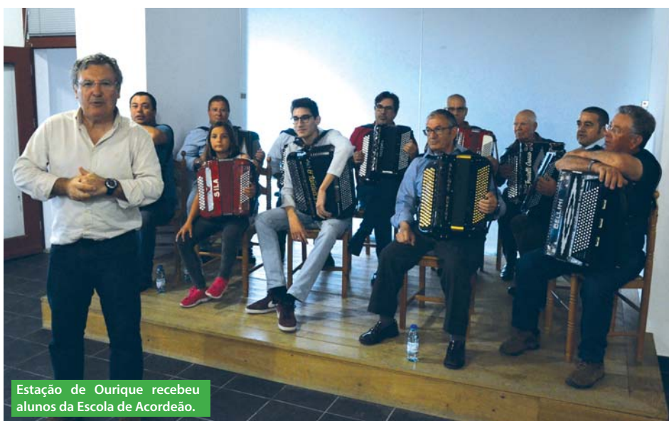
Estação de Ourique recebeu alunos da Escola de Acordeão.