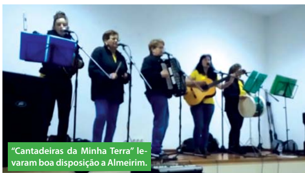
"Cantadeiras da Minha Terra" levaram boa disposição a Almeirim.

» INICIATIVA PASSOU POR AIVADOS, ALMEIRIM, CASÉVEL, ESTAÇÃO DE OURIQUE, GERALDOS, NAMORADOS E PIÇARRAS.