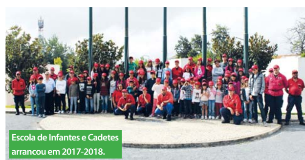
Escola de Infantes e Cadetes arrancou em 2017-2018.

A Escola de Infantes e Cadetes dos Bombeiros Voluntários de Castro Verde é um projecto que vai regressar em 2018-2019, sendo que modelo a seguir será o mesmo, mas agora com mais actividades práticas.